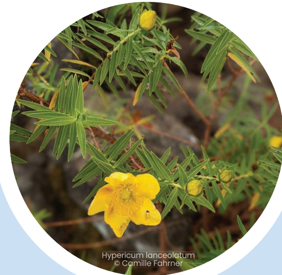
Hypericum lanceolatum

Certains gestes sont indispensables (Gestes 1-2-5-8-9), mais il n'est pas impératif de remplir l'ensemble de ces 15 engagements pour devenir Refuge LPO Péi : il s'agit d'un idéal vers lequel il faudrait tendre.