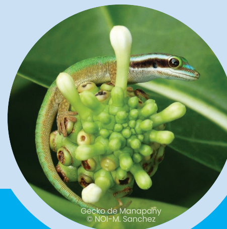
Gécko de Manapañy

Ces 15 engagements, faciles à mettre en pratique chez soi, permettent l'épanouissement et la préservation de la nature de proximité.